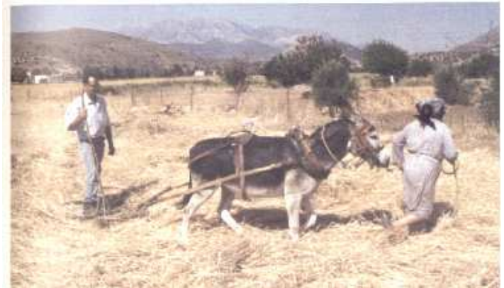
«Γυναίκα Αγρότισσα βοηθάει τον άνδρα της» 1965