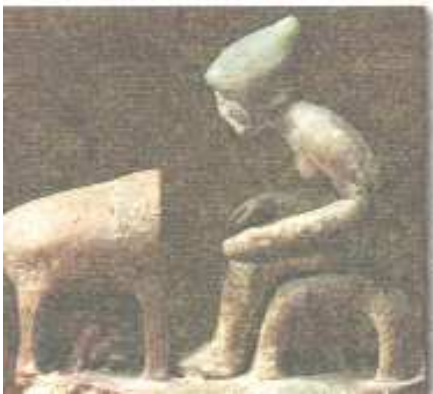
«Γυναίκα καθισμένη μπροστά από το φούρνο της» Βοιωτικό Ειδώλιο Τέλους 5 ου αι. π.χ.