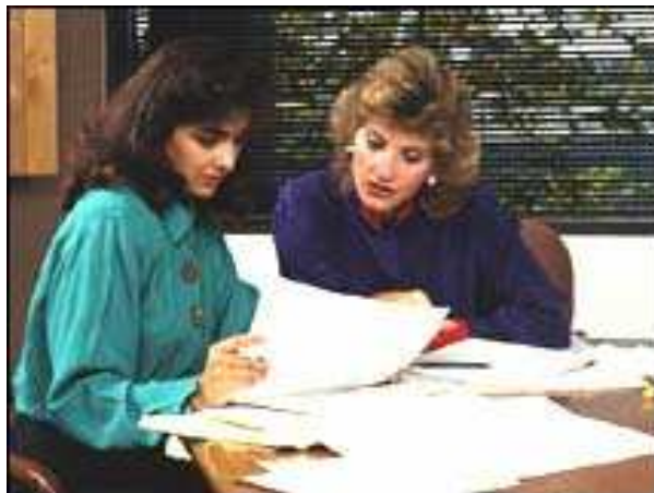
«Γυναίκες Επιχειρηματίες» στην αυγή του 21ου αιώνα»