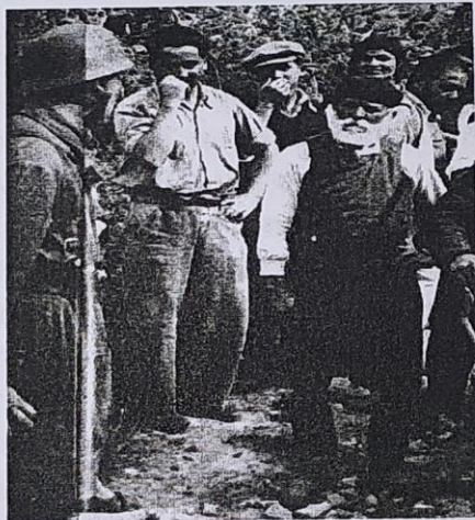
Λίγες ώρες πριν την ομαδική εκτέλεση...

– Νά ξέρεις, Κομαντάτε, πώς όλες οι μανάδες στον κόσμο πονούνε κι' αυτός ο πόνος των μανάδων θα φάει τη Γερμανία! Η Γερμανία θα χαθεί, βάνω την κεφαλή μου: βάνεις στοίχημα, Κομαντάτε;